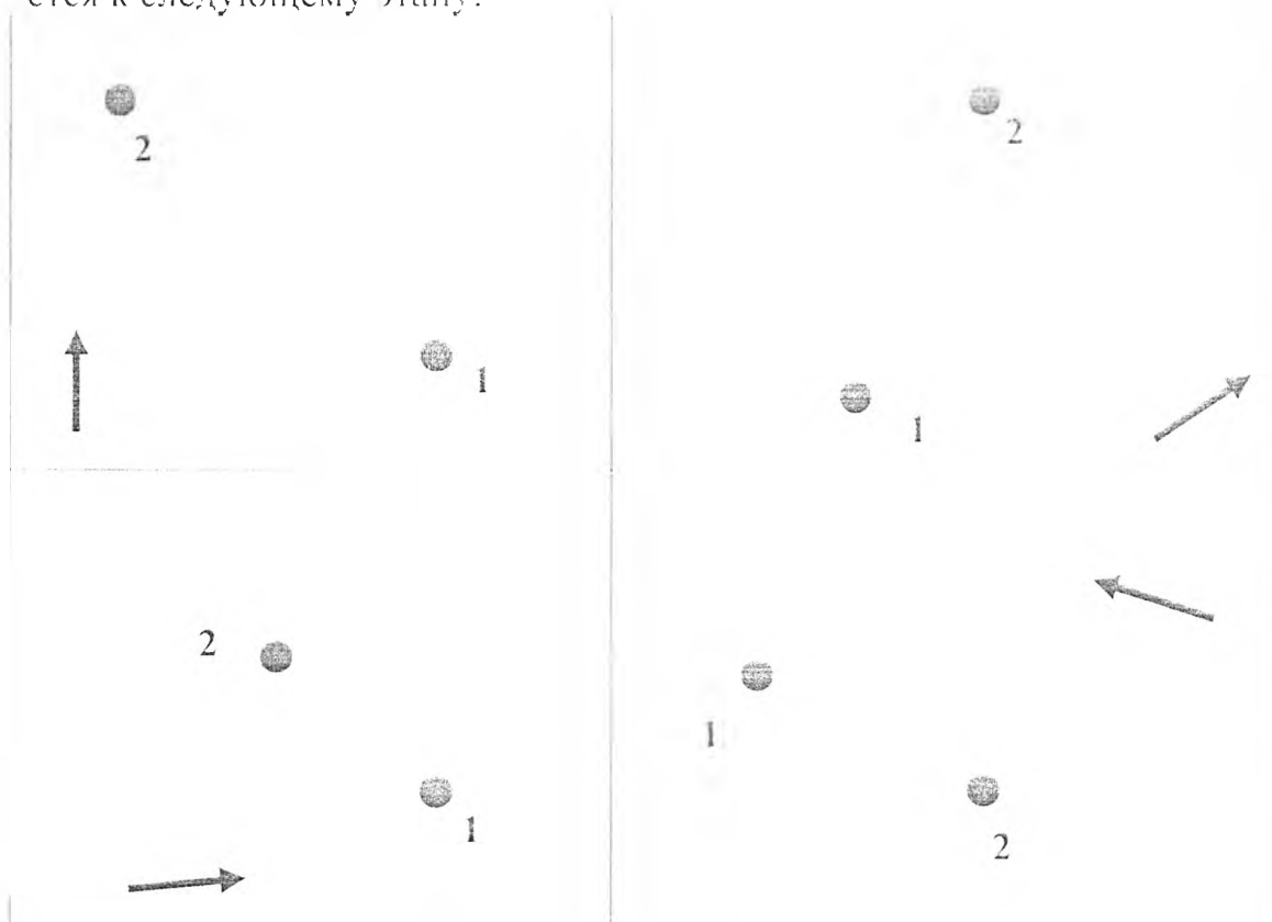
Рисунок № 37 пример индивидуальных заданий «Ориентирование»

Участнику необходимо взять азимут движения от точки 1 до точки 2. Листки сдаются судье, но последнему сдавшему листок отряд выдвигается к следующему этапу.