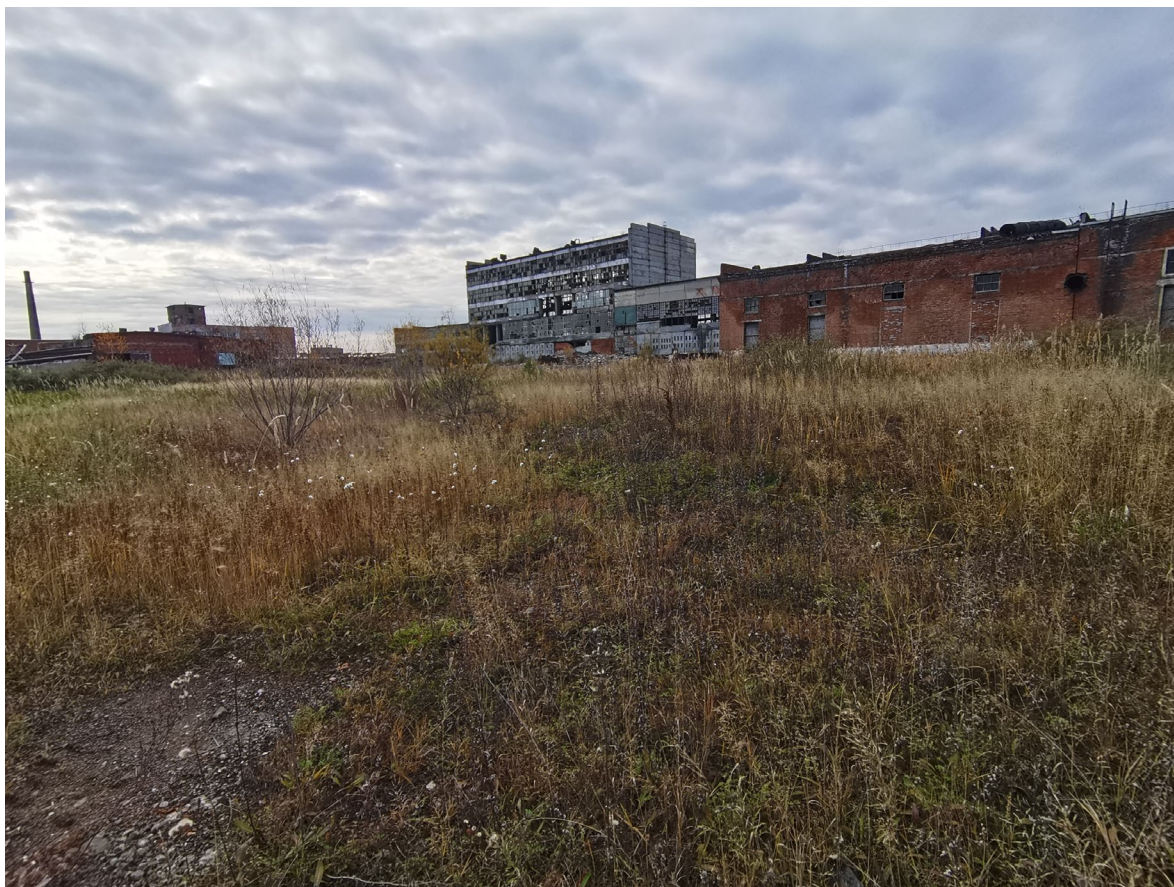
По состоянию на сентябрь 2021 - ликвидирован