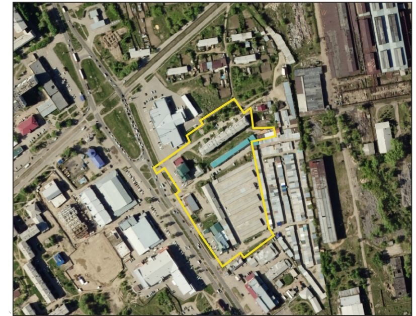
Схема расположения элемента планировочной структуры