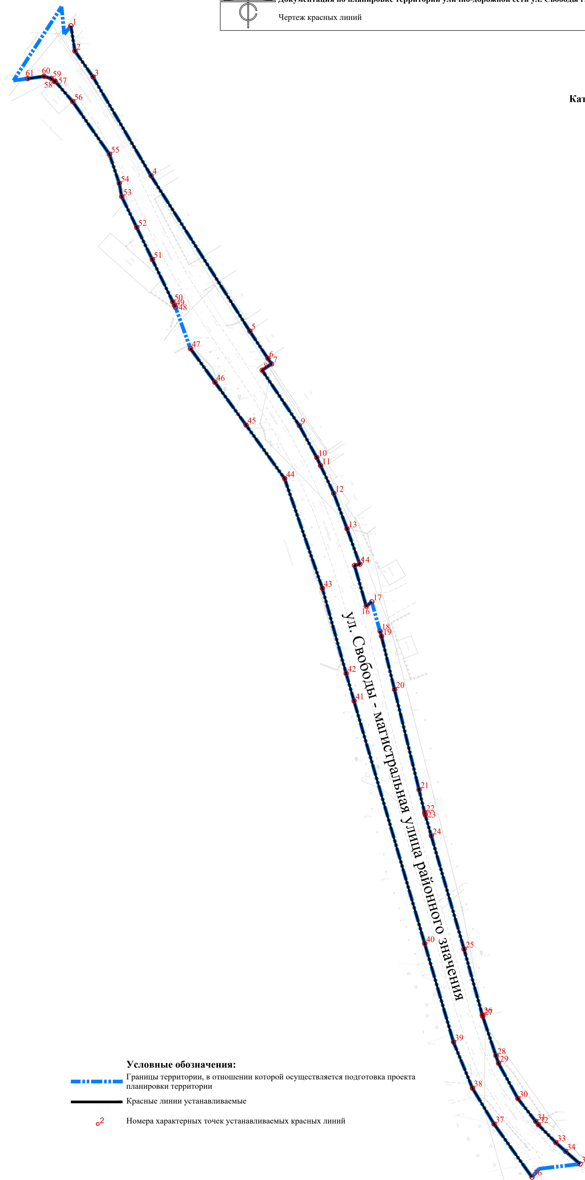
Каталог координат характерных точек красных линий