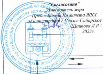
Схема организации движения №4 и ограждения места дорожных работ проспект Комсомольский от ул. Ленина до ул. К. Либкнехта