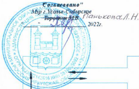
Схема организации движения №2 и ограждения места дорожных работ проспект Комсомольский от ул. Куйбышева до пересечения с федеральной трассой М-53